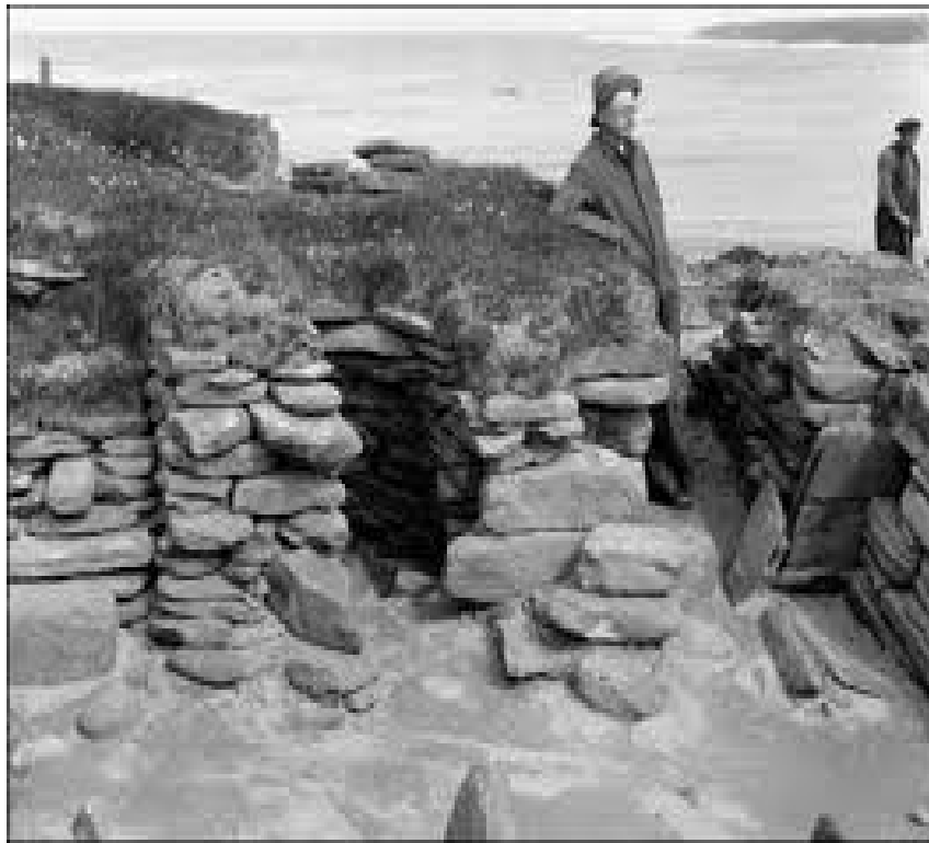
Vere Gordon Childe en las excavaciones del sitio arqueológico Skara Brae en Escocia.

[ ? ] 1978. Descubrimientos en prehistoria . Trata de un recorrido de los descubrimientos prehistóricos en los últimos años hasta 1957. Colocando a la prehistoria cada vez más como una importante área de conocimiento, con la ayuda de cronologías, tipologías, estratigrafía y en aquel momento el radiocarbono 14.