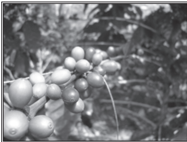
Fotografía 1. El cultivo de café es una de las principales actividades económicas de Santa Rosa de Lima.