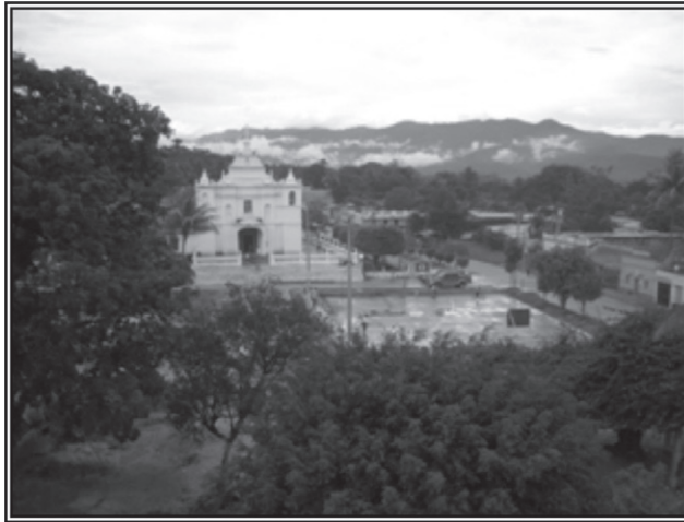
Fotografía 2. Hasta la fecha, el poblado de Santa Rosa de Lima es un pueblo muerto, a pesar de su gran trayectoria histórica, no posee mucho desarrollo como sus pueblos vecinos más recientes.